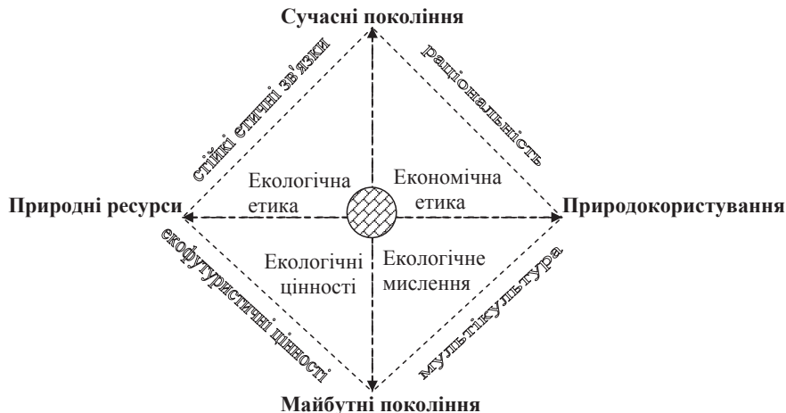
Рис. 1. Глобальний «культурний чотирикутник» сталого розвитку

Досліджуючи екологічні проблеми з точки зору теорії поколінь, як цього потребує концепція сталого розвитку, цілком правомірно розуміти під поколіннями підприємців носіїв певних культурних цінностей. Саме культурні, або природоохоронні, цінності спрямовують екологічну поведінку підприємців у русло ресурсозбереження. Важливим ендегенним чинником ресурсозбереження виступає екологічне мислення підприємця. Під екологічністю мислення