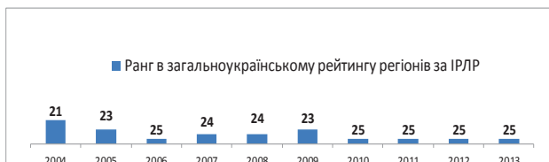
Рис. 2. Місце Житомирської області в загальноукраїнському рейтингу регіонів за рівнем людського розвитку, 2004–2012 рр.