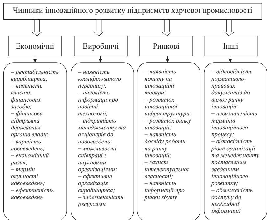
Рис. 2. Чинники інноваційного розвитку підприємств харчової промисловості [13]

Соціальні нововведення реалізуються з метою активізації трудового потенціалу організації шляхом вдосконалення кадрової політики, формування інноваційної системи професійного адаптації, навчання та розвитку працівників, покращення їх соціального захисту, умов праці та мікроклімату у колективі.