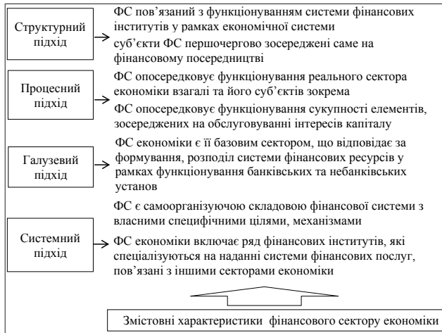
Рис. 1. Система підходів до визначення сутнісних характеристик рис фінансового сектору економіки [3; 5; 6; 7; 9]

– як безпосередньо складова фінансової системи, обслуговуюча фінанси фінансових посередників [3; 5; 6; 7; 9].