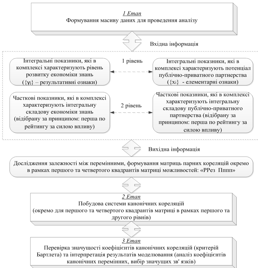
Рис. 1. Послідовність виявлення зв'язків між інтегральними і частковими показниками ЕЗ та потенціалу ППП

Перший квадрант матриці представлено потенційними регіонами-лідерами, економічно успішними