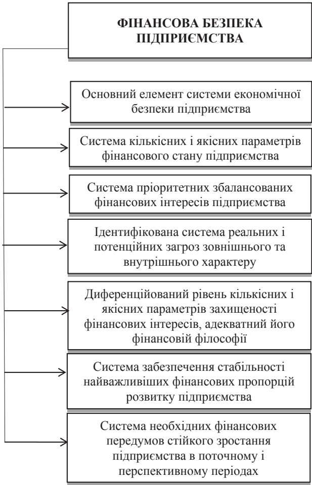
Рис. 1. Сутнісні характеристики фінансової безпеки підприємства

підприємства полягає у створенні й реалізації умов, що забезпечують фінансову безпеку підприємства як на даний час, так і в майбутньому [12, с. 121].