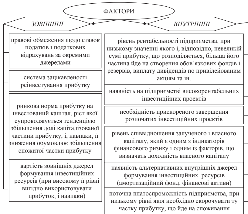
Рис. 2. Фактори впливу на розподіл прибутку підприємства

Аналіз розподілу і використання прибутку здійснюється за наступними напрямками: формування приросту активів на розвиток господарської діяльності в сфері створення об'єктів і соціальної сфери,