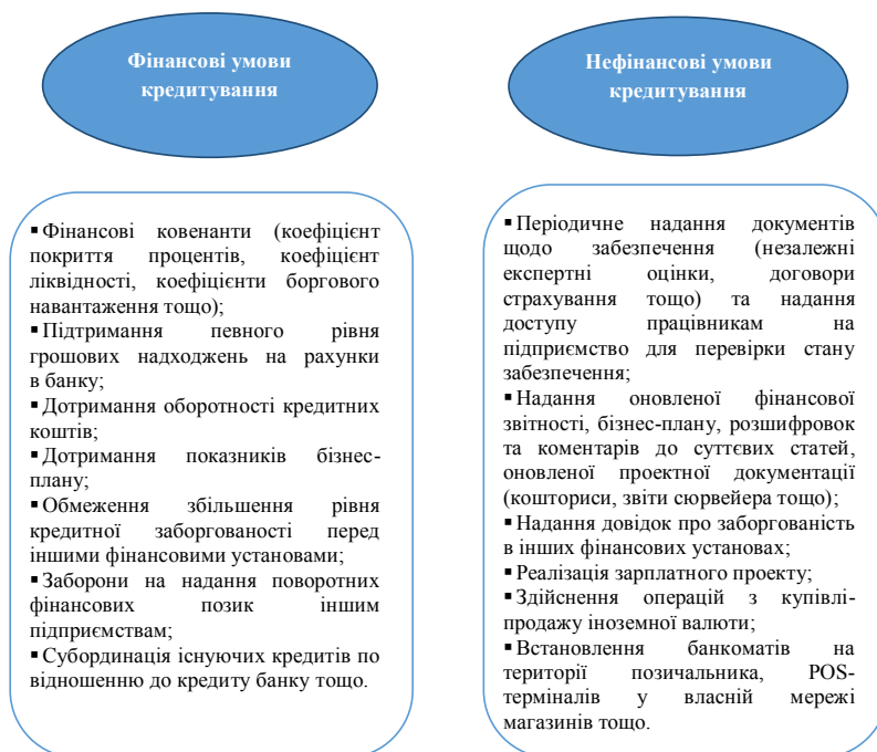
Рис. 2. Типи умов кредитування при структуруванні кредитної угоди (розроблено автором)

Дослідження показали, що, крім зазначених параметрів кредиту, невід'ємною частиною будь-якої угоди про кредитування є передбачення зобов'язань позичальника дотримуватися встановлених умов