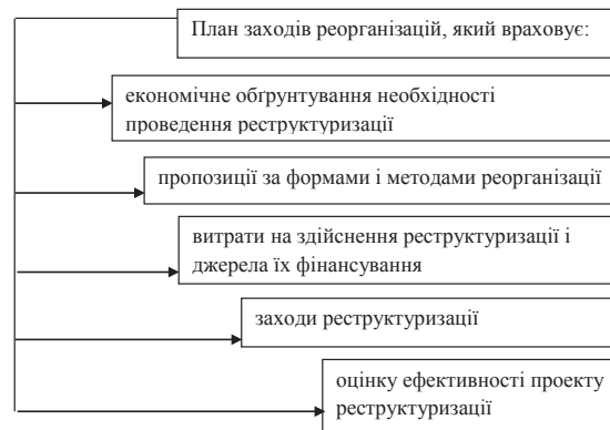
Рис. 2. План заходів реорганізацій

Таким чином, реорганізація підприємства – це припинення діяльності підприємства злиттям, приєднанням, поділом, виділенням, перетворенням з наступним переходом до новостворених підприємств усіх майнових прав та обов'язків підприємства, що реорганізується.