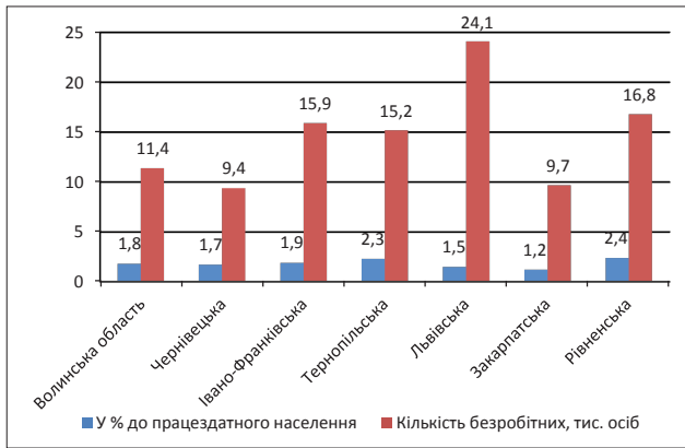
Рис. 1. Кількість безробітних в областях Західної України у 2014 р.