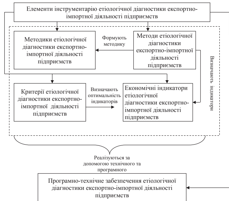
Рис. 1. Структура взаємозв'язків між елементами інструментарію етіологічної діагностики експортно-імпорتنної діяльності підприємств

З метою оптимізації процедури вибору методів етіологічної діагностики експортно-імпорتنної діяль-