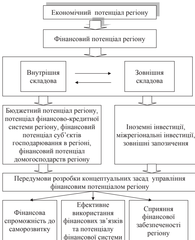
Рис. 2. Фінансовий потенціал в системі забезпечення фінансового управління регіону [3]

Існує значна кількість обґрунтованих методів розрахунку фінансового потенціалу: вартісної оцінки його елементів (нормативний (індикативний), індексний, ресурсно-регресійний), пріоритетної оцінки ресурсів тощо. Для кожного методу притаманні як позитивні, так і негативні сторони залежно від об'єкту дослідження умов його діяльності.