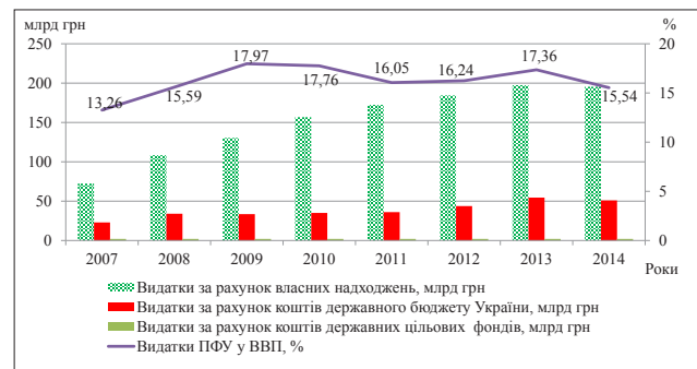
Рис. 1. Динаміка складу витратків Пенсійного фонду України за 2007–2014 рр., млрд. грн.

Важливим показником оцінки фінансової спроможності пенсійної системи країни є співвідношення пенсійних витрат і валового внутрішнього продукту. Частка витратків бюджету Пенсійного фонду України у валовому внутрішньому продукті за наведений період збільшилась на 2,28 відсоткових пункти, що є негативним явищем, середня величина цього показника становила 16,21%. Зазначимо, що обсяг пенсійних витратків за співвідношенням з валовим внутрішнім продуктом досяг найвищого розміру у світі. При цьому не було здійснено ефективних заходів, спрямованих на збільшення власних надходжень пенсійної системи.