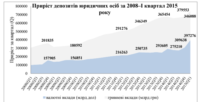
Рис. 3. Приріст депозитів юридичних осіб за 2008–I квартал 2015 року [6; 7]

Невтішною є динаміка і гривневих вкладів фізичних осіб, хоча у порівнянні із попередніми роками та кризою 2008 року (12 9477 млрд грн) їх обсяг стрімко зростав, проте наприкінці 2013 року (257 829 млрд грн) під впливом маси несприятливих чинників обсяги вкладених коштів, відтік став неминучим, а тому станом на перший квартал 2015 року становив -76 278 млрд грн, тобто обсяг коштів на депозитних рахунках в сукупності становив 181 551 млрд грн.