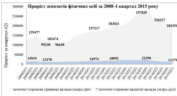
Рис. 2. Приріст депозитів фізичних осіб за 2008–I квартал 2015 року [6; 7]

Реальний відтік валютних депозитів був більшим з огляду на зарегульованість валютного ринку і дефіцит валюти у більшості банків. Таку невтішну ситуацію, зокрема, можна спостерігати на рисунках 2 та 3.