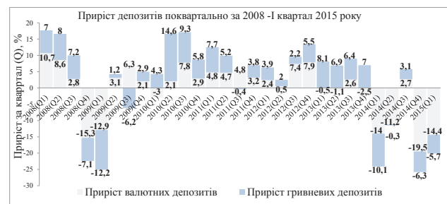
Рис. 1. Prіріст депозитів поквартально за 2008–I квартал 2015 року [6; 7]

У сукупності вплив вищезгаданих чинників, за тих чи інших несприятливих умов, мають вагомий вплив на банківську систему та, зокрема, на її ліквідність. На нашу думку, основною причиною негативної ситуації, що склалася на вітчизняному ринку депозитних операцій в останні роки, у даний час є відтік коштів вкладників у зв'язку з нестабільною економіко-політичною ситуацією в країні. Саме таку тенденцію можна прослідкувати на рисунку 1.