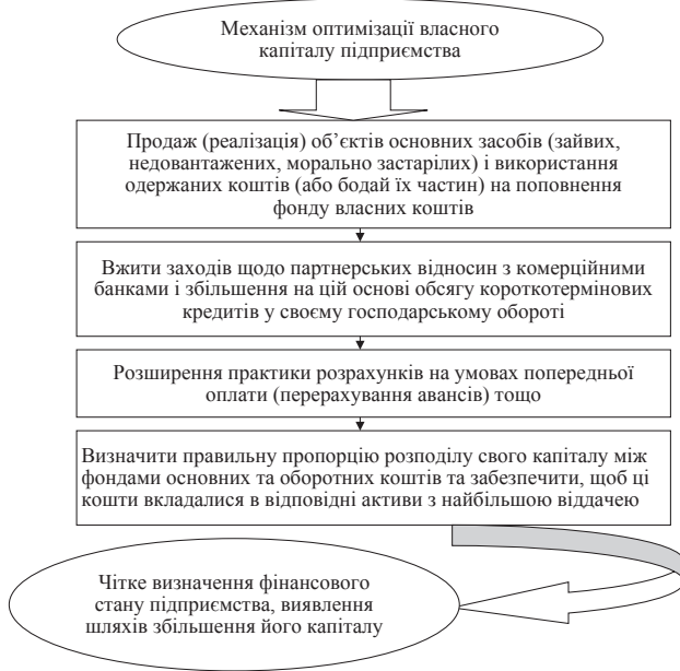
Рис. 1. Механізм оптимізації власного капіталу підприємства

плення та розмежування власності, склад якої наведено на рис. 2.