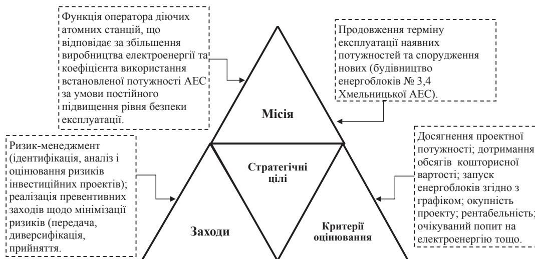
Рис. 1. Структурно-логічна схема оцінювання ефективності ризик-менеджменту стратегічного цілепокладання ДП НАЕК «Енергоатом»

Мионов І. зазначає, що основним принципом ефективного ризик-менеджменту є інтегроване поєд-