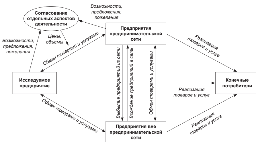
Рис. 1. Представление взаимодействия предприятий в предпринимательской сети

разница между предприятиями, которые принадлежат и не принадлежат к предпринимательской сети, заключается в том, что с предприятиями предпринимательской сети осуществляется более тесное взаимодействие как на уровне информационного обмена, так и на уровне согласования отдельных аспектов деятельности, в частности, цен и объемов поставляемых товаров и услуг. При этом контрагенты вне сети являются независимыми факторами рыночного окружения, в то время как предприятия, принадлежащие к сети, становятся относительно исследуемого предприятия одновременно и объектами и субъектами