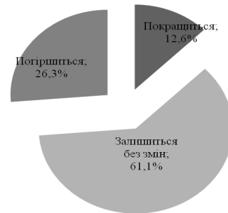
Рис. 3. Питова вага оцінок респондентів щодо фінансово-економічного стану підприємств транспорту, складського господарства, поштової та кур'єрської діяльності, телекомунікації у 2016 р.

Так, відповідно до таблиці 4 і таблиці 5, сільське, лісове та рибне господарство; оптова та роздрібна торгівля, ремонт автотранспортних засобів і мото-