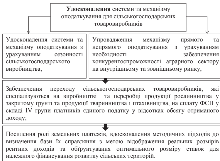
Рис. 2. Удосконалення системи та механізму оподаткування для сільськогосподарських товаровиробників

Таким чином, за результатами проведеної оцінки можна стверджувати, що оподаткування є важливим соціально-економічним інституту суспільства,