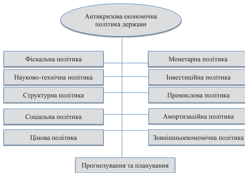
Рис. 2. Напрями антикризової економічної політики держави

Узагальнення міжнародного досвіду дозволяє виокремити низку антикризових інструментів у наступних сферах: розширення пропозиції кредитних ресурсів; підтримка малого й середнього бізнесу; стимули для інвестицій та інновацій; підтримка галузей; підтримка експортерів; податкові інструменти. В якості важливого стимулятора економічної активності у міжнародній практиці розглядається розвиток інфраструктурних проектів. Зокрема, нові інфраструктурні проекти передбачають модернізацію транспортної інфраструктури, енергетики, в тому числі альтернативних джерел енергії, а також сільського господарства [7].