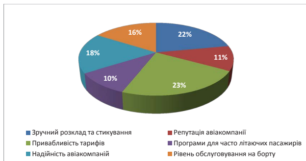
Рис. 2. Статистичні дані вибору відповідного авіаперевізника [4, с. 20]

комфортність умов перевезення пасажера. Найбільш значущими критеріями стали «привабливість тарифів» та «зручний розклад і стикування», потім слідують «надійність авіакомпаній», «рівень сервісу на борту» і т. д. (рис. 2) [4, с. 19].