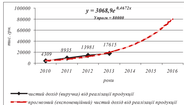
Рис. 1. Фактичні і прогнозовані рівні чистого доходу (виручки) від реалізації продукції (товарів, робіт, послуг)

Для прогнозування основних показників фінансових результатів у досліджуваному господарстві використано статистичний пакет аналізу даних в Excel. В якості аргументів статистичної функції РОСТ, яка обчислює експоненційну апроксиманту даних кривих, використано числові значення чистого доходу від реалізації продукції, валового прибутку, прибутку від операційної діяльності і чистого прибутку за 2010–2013 рр.