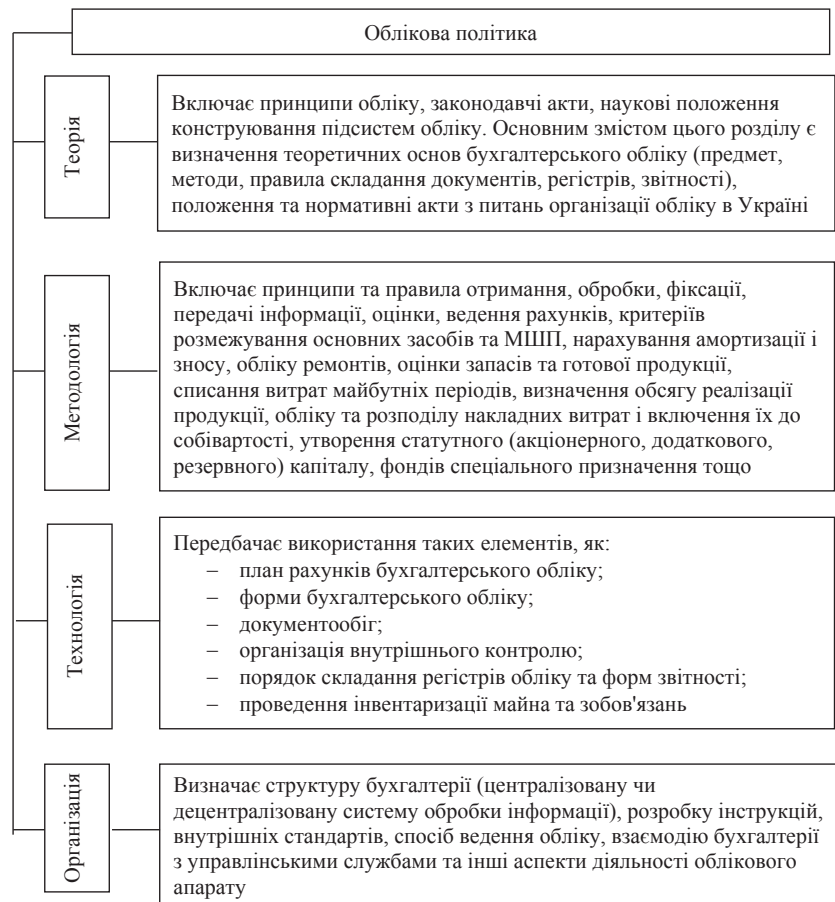
Рис. 1. Елементи облікової політики

Управлінська облікова політика є багатогранною. При розробці управлінської облікової політики можна використовувати досвід фахівців компанії, що займаються веденням управлінського обліку, а також найкращий світовий досвід, відбитий у між-