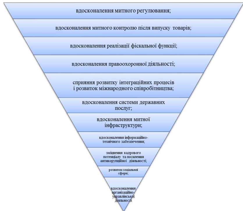
Рис. 2. План модернізації митної системи України (авторська розробка)