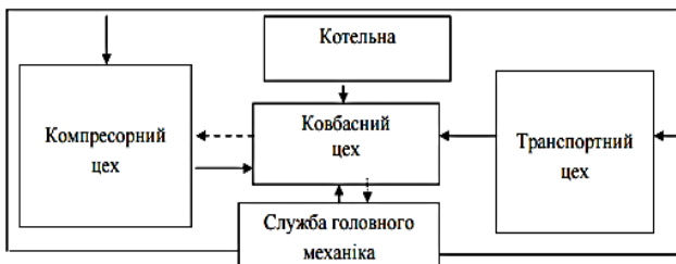
Рис. 1. Виробнича структура м'ясопереробного підприємства

Це, в першу чергу, пов'язано з налагодженням тісних взаємозв'язків між виробничими підрозділами, обумовленими формою їх спеціалізації (на м'ясопереробних підприємствах – технологічна спеціалізація). На рис. 1 подано типову виробничу структуру м'ясопереробних підприємств, що відображає тісні виробничі взаємозв'язки між підрозділами.