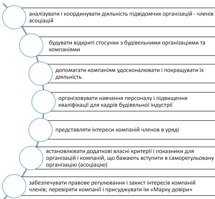
Рис. 2. Вимоги до будівельних організацій