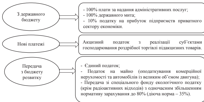
Рис. 1. Розширення доходів загального фонду місцевих бюджетів України у процесі бюджетної реформи 2015 р.

Висновки. Можна стверджувати, що у процесі бюджетно-податкового реформування спочатку відбувається зміна бюджетного та податкового потенціалу регіону, під їхнім впливом змінюється фіскальний