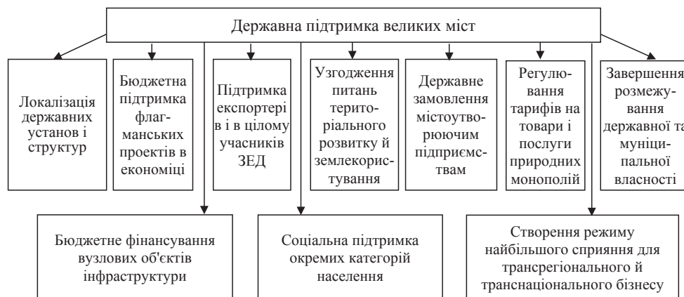
Рис. 2. Основні напрями державної підтримки розвитку великих міст із урахуванням фактора глобалізації

рівнях (у провідному місті українського Півдня – Одесі, незважаючи на статус муніципалітету-донора, безоплатні перерахування з обласного бюджету в складі дохідних джерел становлять 30-40%).