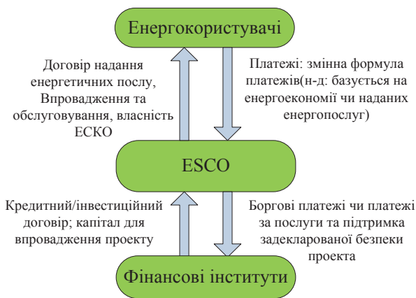
Рис. 3. Модель розподілу енергозаощаджень

послуг енергоефективного фінансування, підготовки проектів до інвестування, розробки нових фінансових продуктів для впровадження енергоефективності та побудови можливостей особливого фінансування таких проектів. Це також включає підтримку енергоефективних та енергоуправляючих підприємств для розбудови їх корпоративних можливостей і розробки ЕЕ-проектів, ведення цілеспрямованої популяризації ЕЕ-ринку, здійснюючи в цілому кооперацію з іншими організаціями [4]. Під проводом Програми комерціалізації ЕЕ-фінансування 14 банків, що беруть у ній участь, фінансують 829 проектів на загальну гарантовану суму $49,5 млн. Ці проекти відображають загальні інвестиції приблизно в $208 млн. [9].