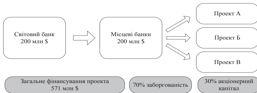
Рис. 2. Програми фінансування енергоефективності Китаю (СНЕЕФ)

Міжнародна фінансова корпорація використовує 50% механізм розподілу ризиків для цієї програми, а Міжнародний екологічний фонд передав $17,25 млн. програмі, з яких $15 млн. виділено для надання гарантій, а $2,25 млн. – для використання на операційні витрати програми і технічної підтримки. Технічна підтримка програми націлена на допомогу у виокремленні та підготовці проектів для інвестування та будівництва енергоефективних заходів і оцінки банківських можливостей у кожній країні. Програма залучає банки для допомоги впровадження