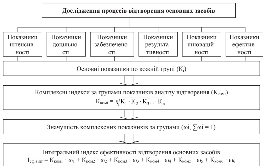
Рис. 2. Концептуальний підхід до розрахунку інтегрального індексу ефективності відтворення основних засобів сільськогосподарських підприємств

8. Пошук та обґрунтування джерел фінансування оновлення основних засобів з урахуванням очікуваної прибутковості та вартості джерел відтворення. У разі неможливості повного задоволення потреби в інвестиційних ресурсах для реалізації програми технічного переозброєння слід обрати найбільш ефективні заходи та визначити раціональну черговість реалізації запланованих заходів.