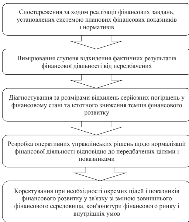
Рис. 2. Основні функції фінансового контролінгу

Функції фінансового контролінгу можна визначити за його метою, якою є діагностування фінансового стану, визначення тенденції економічного розвитку та запобігання впливанню негативних факторів на розвиток підприємства. Універсальними для всіх видів контролінгу є такі функції: інформування, планування, контроль, управління, координування, адаптація та прогнозування. Щодо основних функцій фінансового контролінгу, то можна виділити наступні (рис. 2)