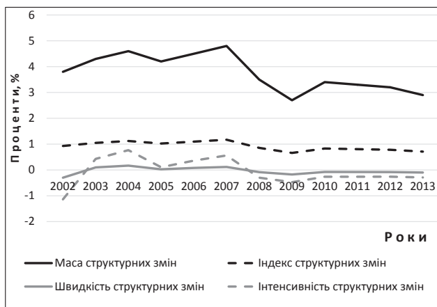
Рис. 1. Результати аналізу структурних змін будівельної галузі у період 2001–2013 рр. (%)

У процесі даних розрахунків будівництво розглядається виключно як вид економічної діяльності відповідно до класифікатора ВЕД Державної служби статистики України і не включає видобування сировини, виробництва будівельних матеріалів і послуг, пов'язаних із процесом утворення та реалізації будівельної продукції (будівель і споруд).