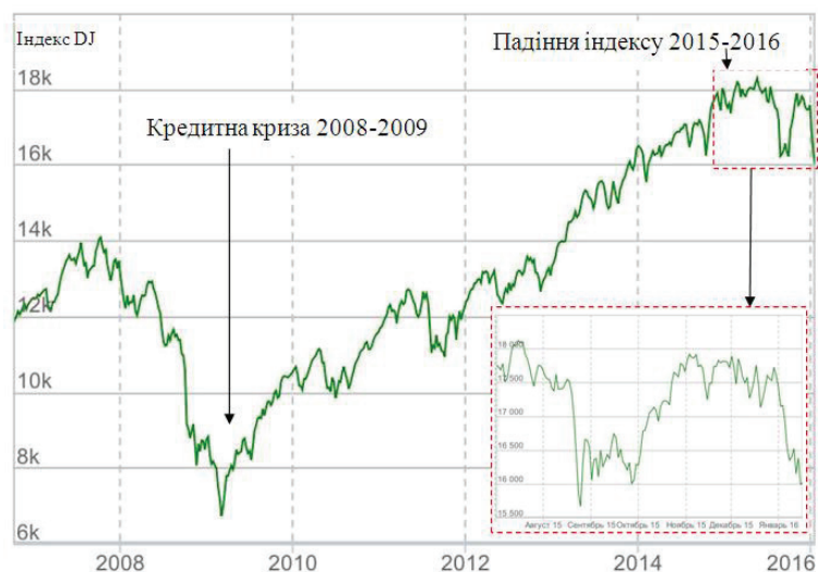
Рис. 1. Індекс Dow Jones, 2006–2016

із ринками, що формуються. За 9 місяців 2008 р. міжнародні інвестиційні фонди, які спеціалізуються на інвестиціях в економіки з ринками, що формуються, вивели з них 32,5 млрд дол. США (тоді як у січні-вересні 2007 р. було вкладено 20,6 млрд дол.) [3]. На думку І. Шумпетера [4], кожній кризі властива своя психологічна картина, що формує відношення до інвестицій. Паніка і розбрід кризового стану ведуть до застою капіталовкладень, підвищений настрій в умовах підйому стимулює гарячку.