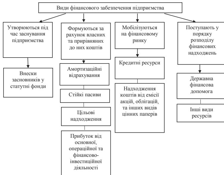
Рис. 1. Види фінансового забезпечення підприємства

У разі незадовільної діяльності підприємства, тобто виходу так званої зони стійкого зросту,