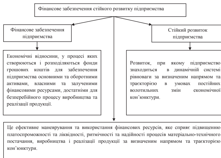
Рис. 3. Фінансове забезпечення стійкого розвитку підприємства