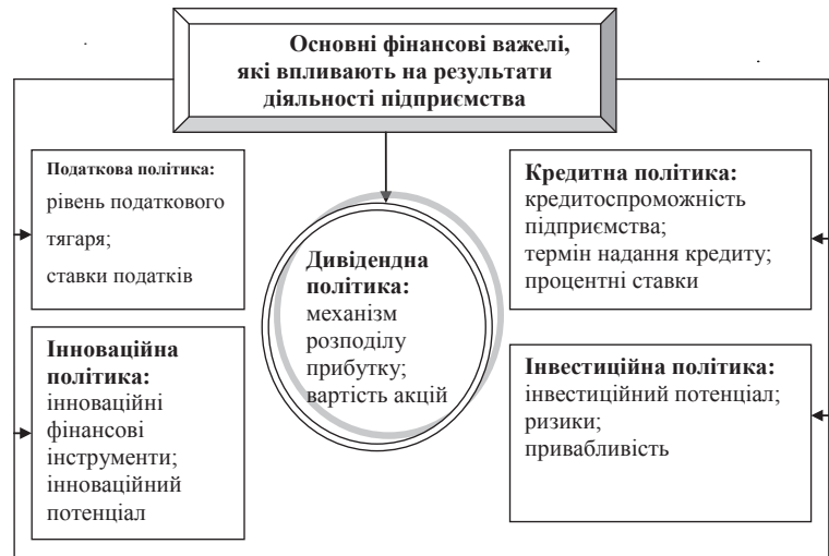
Рис. 1. Фінансові важелі, які впливають на результати діяльності підприємства

Необхідно констатувати, що стан підприємства, його економічні показники залежать як від зовнішніх, так і внутрішніх факторів. До зовнішніх факторів