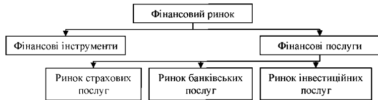
Рис. 1. Структура і місце фінансових послуг на фінансовому ринку

Що стосується України, то з приходом до неї потужного міжнародного фінансового капіталу, передусім у банківський і страховий сектори та на фондовий ринок, на вітчизняному фінансовому ринку активізувалися й інтенсифікувалися процеси інтеграції та конвергенції. Проте сучасна динаміка зовнішньої торгівлі Україною фінансовими послугами свідчить про наявність структурних диспропорцій та