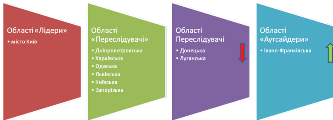
Рис. 3. Динаміка результатів кластерного аналізу

привабливості регіонів із використанням інтегрального показника, побудованого на основі комплексу факторів з урахуванням їх вагомості. Результати, отримані в процесі проведених розрахунків, у цілому співпадають із загальною статистикою по міграції в межах України.