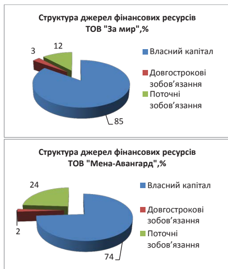
Рис. 3. Структура джерел фінансових ресурсів господарств за 2014 р.

Наочно структуру джерел фінансових ресурсів господарств можна зазначити графічно за допомогою рис. 3: