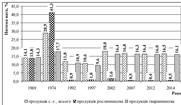
Рис. 2. Частка сільськогосподарської продукції, реалізована за договорами виробничої контрактації, %

Наведені на рис. 2 дані свідчать, що динаміка питомої ваги контрактованої продукції сільськогосподарства істотно залежить від урядових ініціатив і програм.