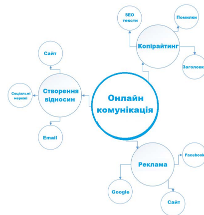
Рис. 4. Структура онлайн-комунікації [4]

Однією з помилок багатьох компаній є те, що вони просто публікують потік не пов'язаних між собою постів. Навіть якщо у них є графік публікацій, здебільшого це не призводить до побудови якоїсь стратегії. У цьому аспекті група компаній «НІКО» ефективно розробила маркетингову стратегію і змогла слідувати за структурою всієї онлайн-комунікації, яка має приблизно такий вигляд (рис. 4). У межах стратегії варто не забувати про правильний аналіз отриманих результатів. Отримані результати та висновки варто використати групі компаній «НІКО» для проведення стратегії просування, адже стає відомо, які пости привертають більше трафіку, а які краще конвертують.