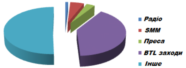
Рис. 2. Розподіл витрат відділу маркетингу за жовтень 2015 р. [2]

чено актуальний розподіл витрат відділу маркетингу та реклами за жовтень 2015 р. (рис. 2).