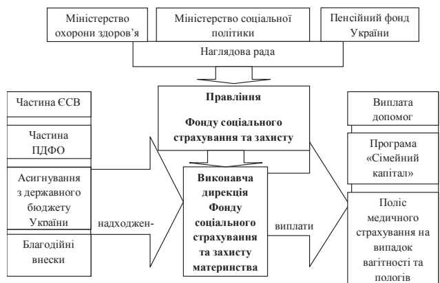
Рис. 1. Схема функціонування Фонду соціального страхування та захисту материнства в Україні