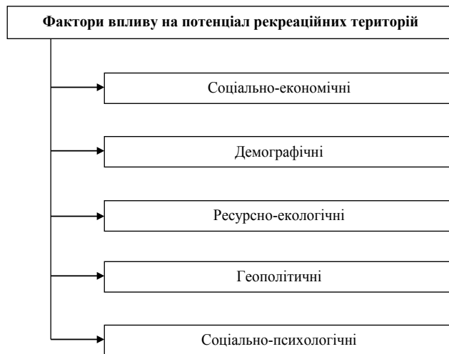
Рис. 2. Фактори впливу на потенціал рекреаційних територій

Циклічність. Однією з найважливіших властивостей рекреаційних територій є циклічність надання рекреаційних послуг. Тобто рекреаційні властивості територій повинні або повністю відновлюватись в часі до моменту їх наступного використання, або їх використання взагалі не повинне зменшувати їх цінності. Якщо ці вимоги не задовольняються, суб'єктам надання рекреаційних послуг потрібно здійснювати витрати на приведення рекреаційних територій до їх первинного стану.