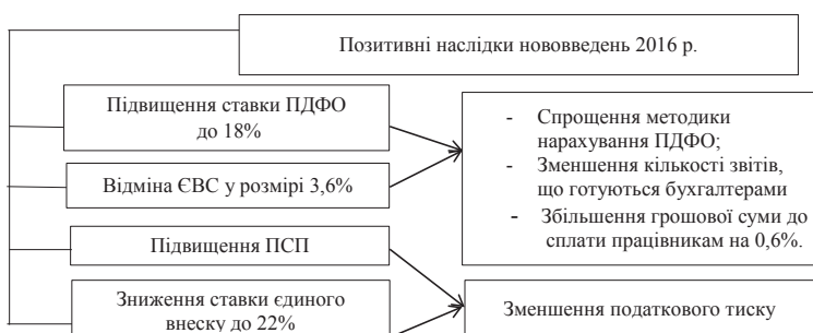
Рис. 2. Основні позитивні моменти запровадження змін у 2016 р.

Висновки. Отже, всі зміни та нововведення, що відбулися в 2016 р., покликани реформувати та вдосконалити оплатно-трудова відносини не лише в бюджетній сфері, а й в Україні в цілому. Крім того, внесені зміни значною мірою вплинули на бухгалтерський облік, а саме на методику нарахування. Загалом, необхідно очікувати позитивного впливу реформ 2016 р.