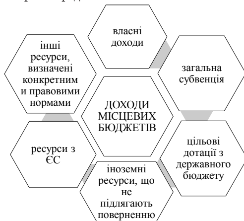
Рис. 2. Класифікація доходів місцевого самоврядування в Польщі

Фінансова система органів місцевої влади в Польщі після реформи почала функціонувати на засадах доповнюваності та чіткого розподілу сфер повноважень [7]. Відповідно до системи фінансового забезпечення повноважень та сфер відповідальності органів субнаціонального рівня державного управління до фонду загальних субвенцій здійснюється відрухування визначеної частки доходів державного бюджету, а також внески більш забезпечених місцевих урядів; його основні компоненти – базова загальна субвенція, освітня субвенція, субвенції на компенсацію втрачених внаслідок рішень центральних урядів доходів. Інвестиційні субвенції віднесено до категорії цільових, які розподіляються між воєводствами, а воєводи здійснюють їх розподіл між гмінами. Обсяг загальної субвенції для повітів та воєводств Польщі не фіксується, а визначається законами про бюджет і складається з трьох частин: на освіту, дорожнє господарство та вирівнювання [9, с. 6]. Доходи місцевого самоврядування (див. рис. 2) у широкому розумінні формуються також за допомогою частки надходжень від податку на доходи фізичних осіб та податку на доходи юридичних осіб. Відповідна норма, з метою заохочення громад до об'єднання, передбачає додаткових 5% цього податку для відповідного об'єданого бюджету з поступовим збільшенням цієї частки. Також громади й комуни Польщі як юридичні особи можуть брати кредити в банках.