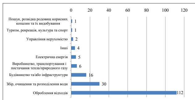
Рис. 2. Розподіл проектів ДПП за сферами господарської діяльності станом на 1 січня 2016 р.

Важливо також указати на певну невідповідність статистичних даних Світового банку та офіційних даних Мінекономрозвитку щодо кількості конче-