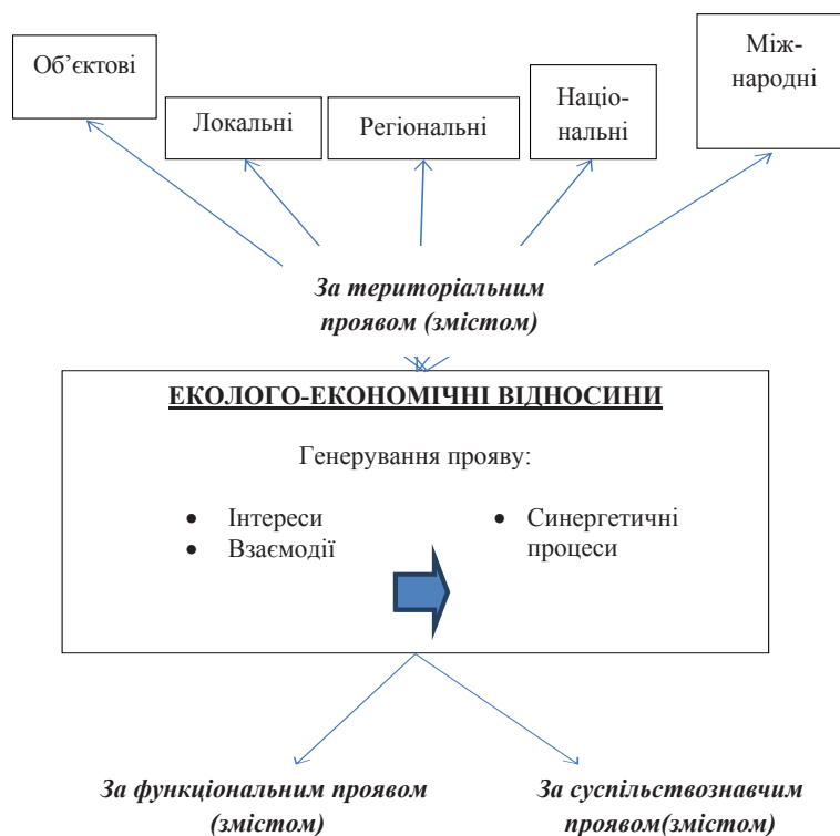
Рис. 1. Класифікація еколого-економічних відносин (розроблено автором)