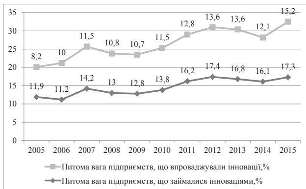
Рис. 2. Показники інноваційної активності підприємств, 2005–2015 рр. [3]

Впровадження інновацій у 2015 р. здійснювали 15,2% інноваційно-активних промислових підприємств, цей показник є найвищим за останні 10 років. Найнижчого значення цей показник досягнув у 2005 р. – 8,2%.