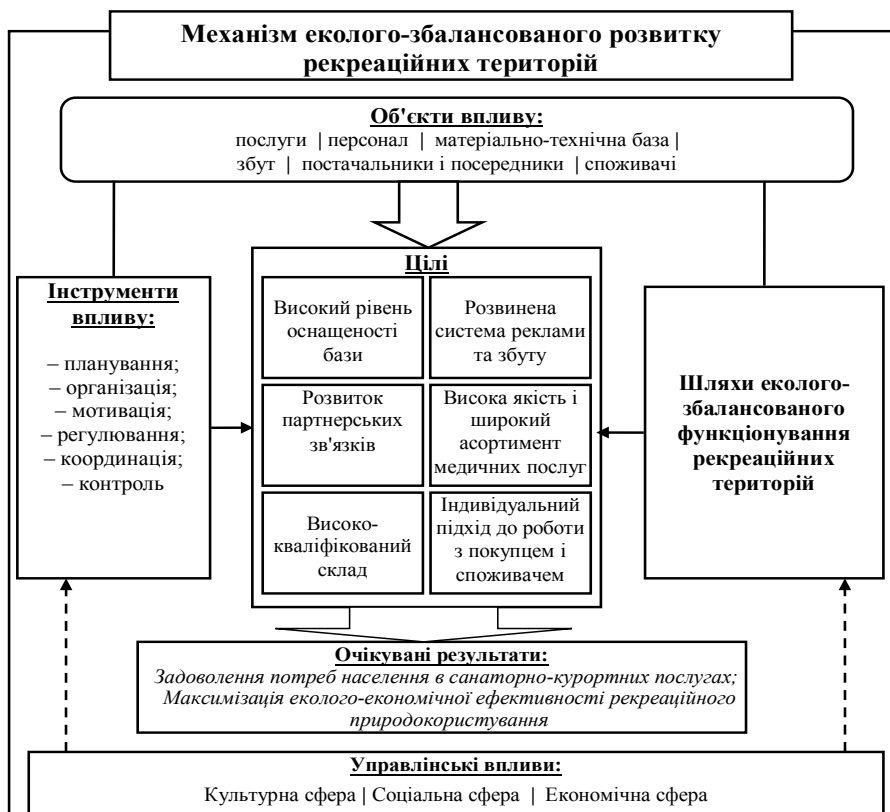
Рис. 2. Структурно-логічна модель функціонування механізму еколого-збалансованого розвитку рекреаційних територій

Таким чином, процес стимулювання еколого-збалансованого розвитку рекреаційних територій доцільно, насамперед, розглядати через призму теорії мотивації. Якщо на систему впливають стимулюючі заходи, то відбувається повне