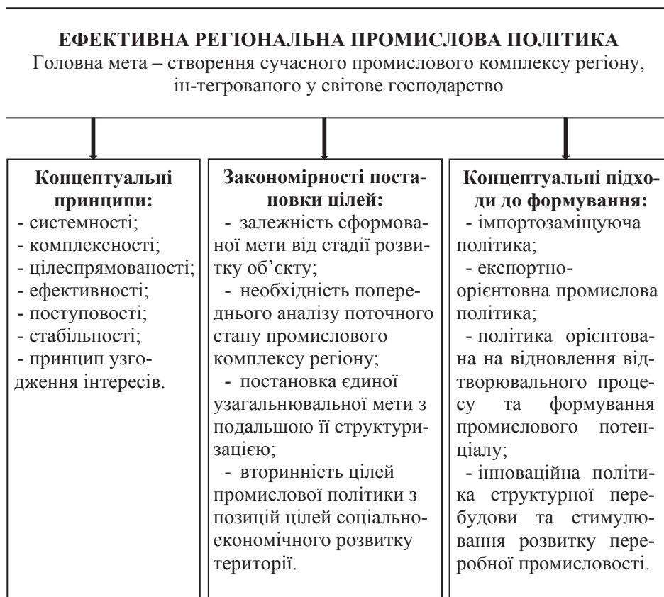
Рис. 2. Концептуальні підходи до формування ефективної регіональної промислової політики

Наступний вид промислової політики, який застосовують у Європейському Союзі, пов'язаний із її формуванням за горизонтальним принципом. Заходи промислової політики спрямовані на рівномірний та конкурентний розвиток усіх секторів, галузей та сфер діяльності на рівні регіону, в обставинах виходу економіки з кризи, коли починає відновлюватися