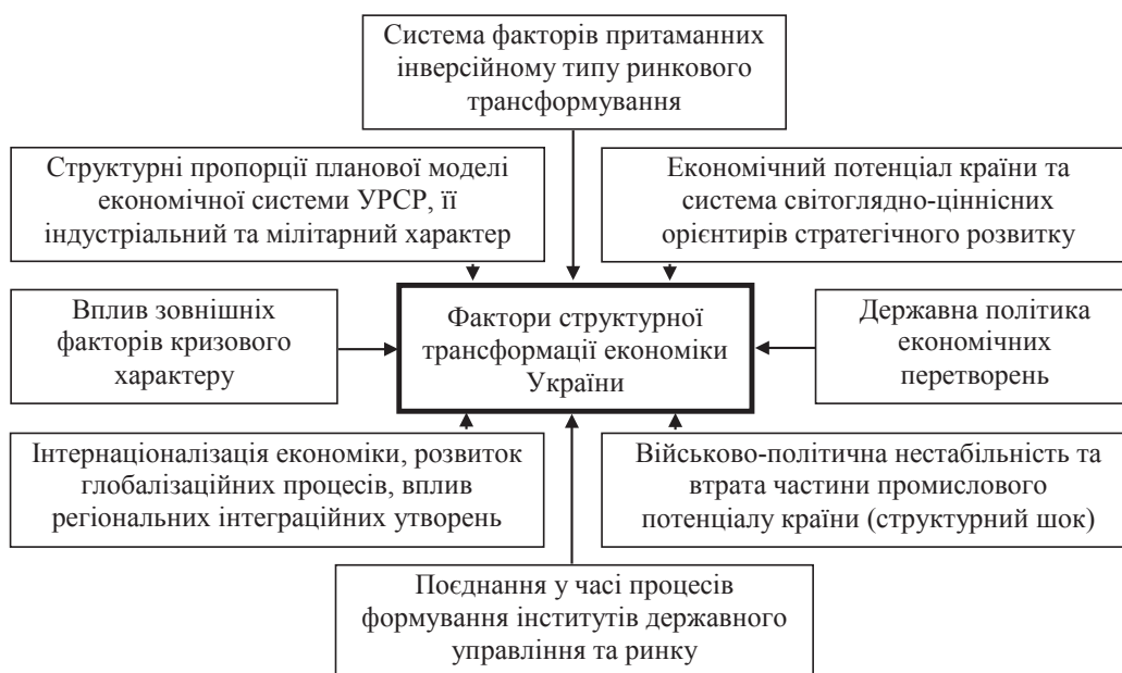
Рис. 2. Фактори структурної трансформації економіки України

Визначальними причинами у 1990-х роках, все ж були причини соціально-політичного характеру, а саме, – несприйняття населенням цінностей ринку та відсутність політичної підтримки ринкових реформ. В силу стихійності процесів розвитку трансформаційної кризи у зазначений період, можливості вибору раціональної поведінки держави були обмежені. Найважливіше, що вдалося реалізувати, – сформувати базові інститути нового державного утворення, запровадити основні принципи ринку та завершити велику приватизацію, в результаті якої виник новий прошарок крупних власників. Разом з тим, важливо відзначити і причини пов'язані з концептуальною помилковістю у підходах до формування та реалізації економічної політики, які особливо яскраво проявилися у період висхідної динаміки розвитку. Теза про стимулювання економічного зростання будь-яким способом, фактично стала домінуючою, лежала в основі політики, і як показав досвід, в стратегічному плані виявилася руйнівною. Тенденція економічного зростання протягом 2000-2008 років, саме